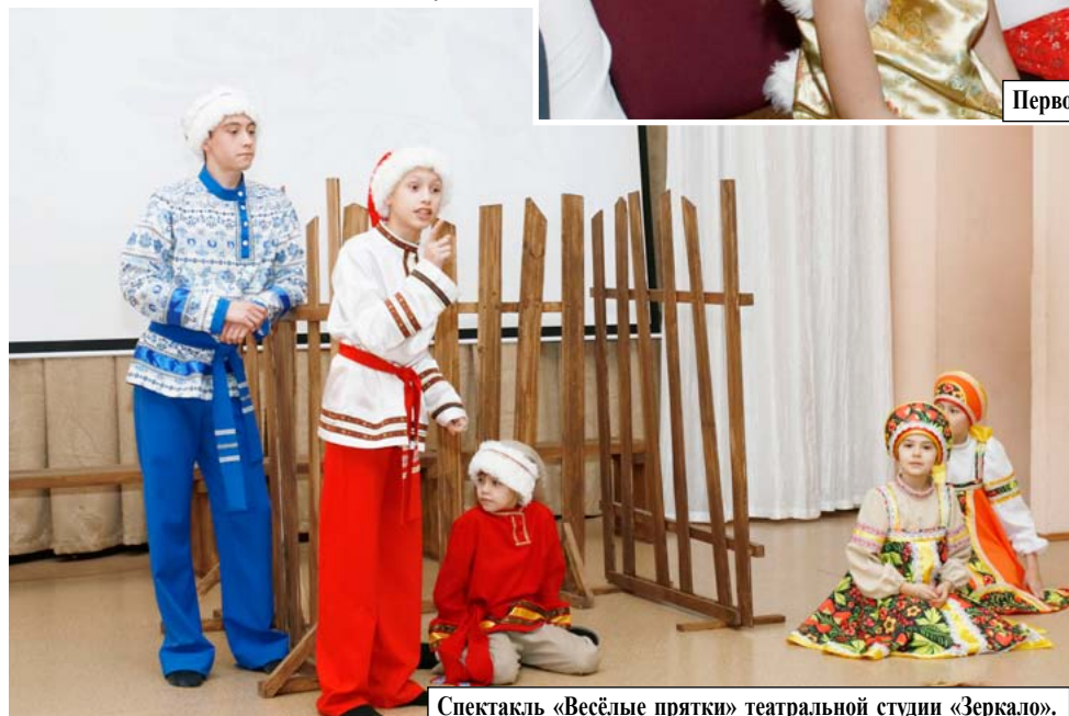
Спектакль «Весёлые прятки» театральной студии «Зеркало».

ные стены заглянули воспитанники театральной студии «Зеркало» ЦДТ «Октябрьский». Юные актёры показали новогодний спектакль «Веселые прятки». Болотная кикимора, черти, домовые и Кашей развлекали ребят. От души благодарим ребят и руководителей!