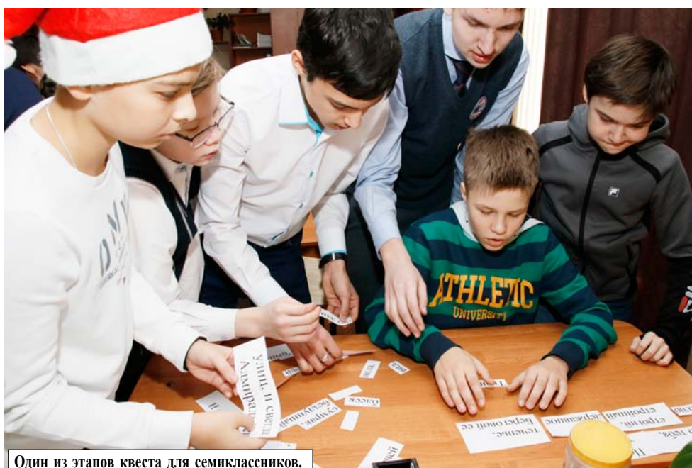
Один из этапов квеста для семиклассников.