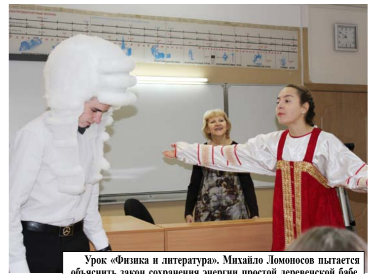
Урок «Физика и литература». Михайло Ломоносов пытается объяснить закон сохранения энергии простой деревенской бабе.