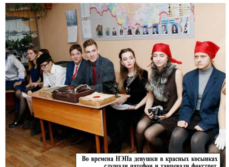
Во времена НЭПа девушки в красных косынках слушали патефон и танцевали фокстрот.

Зощенко «Аристократка», патефон пел нам революционные песни, даже Остап Бендер посетил этот урок. И все это в