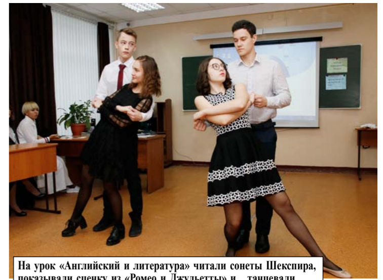
На урок «Английский и литература» читали сонеты Шекспира, показывали сценку из «Ромео и Джульетты» и... танцевали.