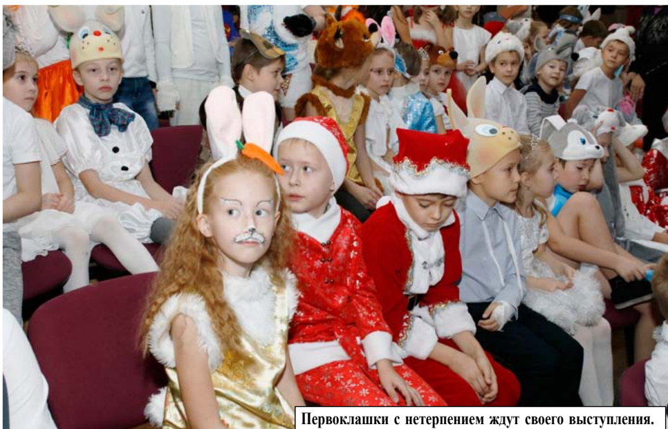
Первоклашки с нетерпением ждут своего выступления.