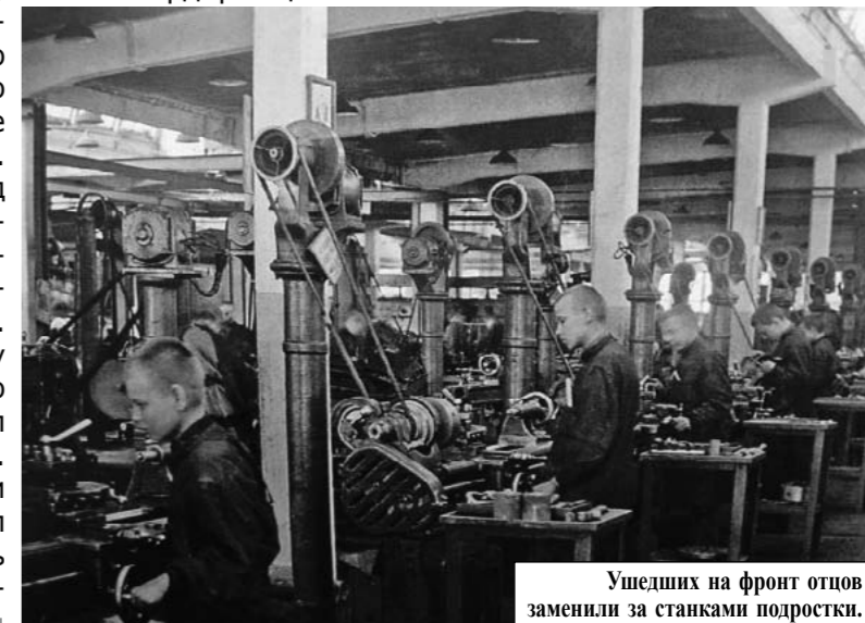
Ушедших на фронт отцов заменили за станками подростки.

Пресс-центр МБОУ Гимназия № 44 г. Иркутска