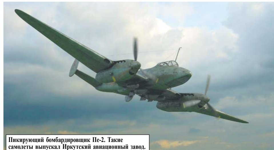
Пикирующий бомбардировщик Пе-2. Такие самолеты выпускал Иркутский авиационный завод.

Сюда же были перебазированы 3 обувных предприятия: обувная фабрика из Днепропетровска с 386 рабочими и 27 вагонами оборудования, хромовый завод из Серпухова, модельная мастерская с сырьем из Одессы. Последние два влились в Иркутские обувную и кожевенную фабрики, а Днепропетровская обувная фабрика была сохранена как самостоятельное производство. Ее разместили в недостроенном здании пожарного депо в Ленинском районе. Уже к середине октября 1941 г. фабрика была пущена в строй (оборудование прибыло 5-18 сентября 1941 г.), а к середине декабря она стала выпускать 85% своего плана.