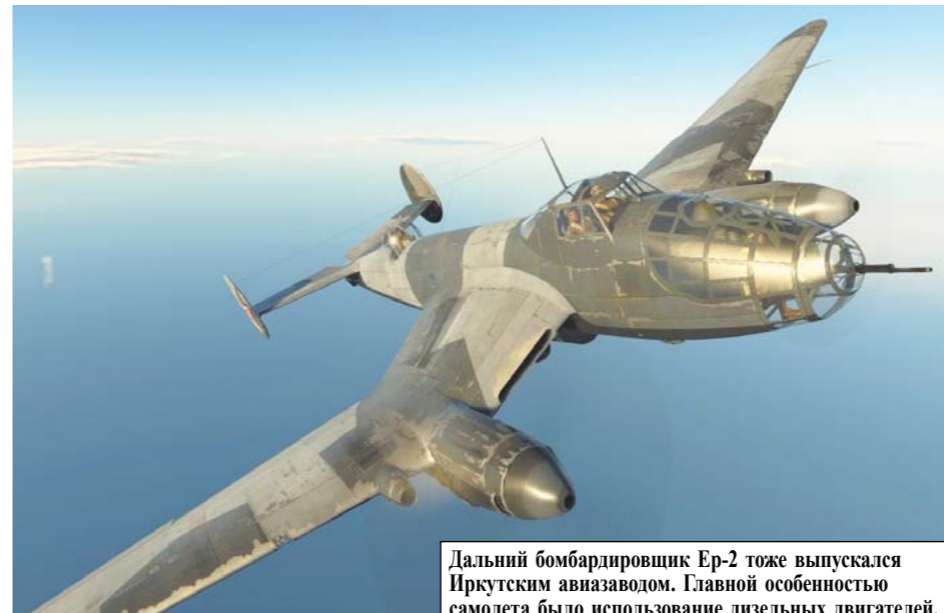
Дальний бомбардировщик Ер-2 тоже выпускался Иркутским авиазаводом. Главной особенностью самолета было использование дизельных двигателей.

Во время войны состав рабочих и служащих заводов пополнялся молодыми рабочими и даже подростками, заменившими своих отцов за станками.