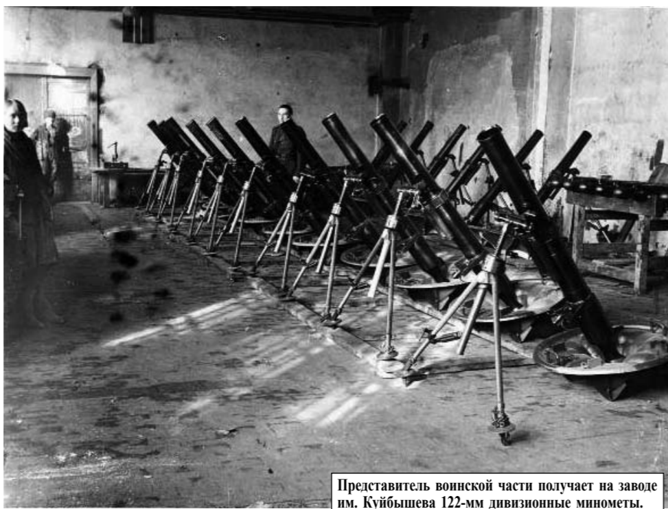
Представитель воинской части получает на заводе им. Куйбышева 122-мм дивизионные минометы.

С началом войны промышленность города была переведена на обслуживание нужд фронта. На выпуск военной продукции были переведены не только крупные, но и мелкие предприятия местной и кооперативной промышленности, выпускавшие прежде сугубо гражданскую продукцию. Они перешли на выпуск оружия и боеприпасов. Более 50 предметов оборонного значения стали производить на этих предприятиях, в том числе самолеты и зап-