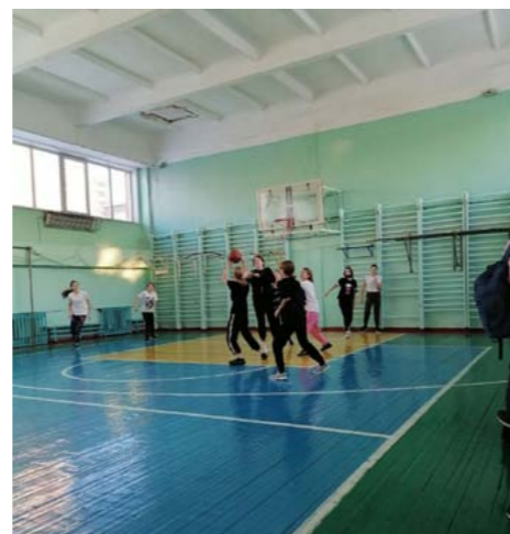
Соревнования 15 января

13 января — прошли соревнования по баскетболу среди девушек 5-ых классов. По итогам 1 место у 5 «В» класса, 2 место — 5 «И», 3 место — 5 «Г».