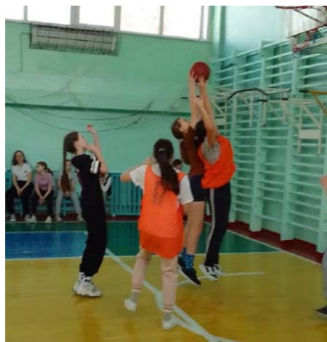
Соревнования 13 января

10 декабря — команда юношей Гимназии № 44 заняла 3 место в финальном первенстве города по баскетболу!