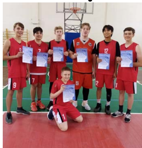
Соревнования 10 декабря

10 декабря — команда юношей Гимназии № 44 заняла 3 место в финальном первенстве города по баскетболу!